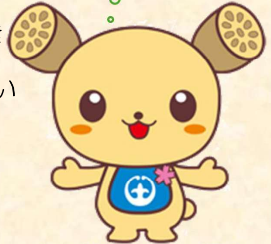
土浦市イメージキャラクター つちまる