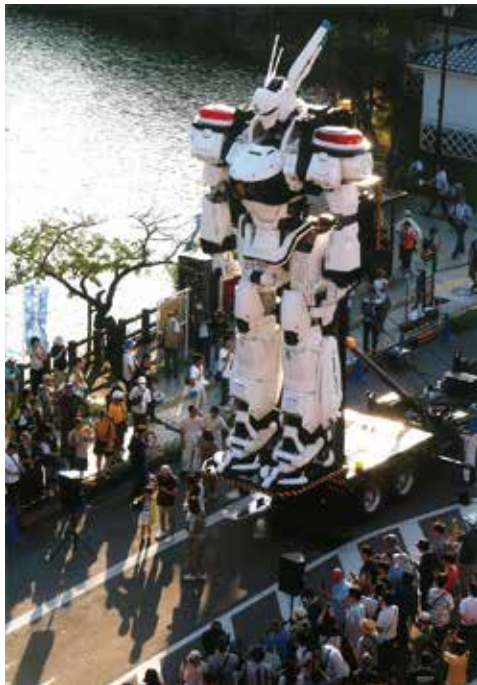
優秀賞 土浦市長賞 「土浦に巨大ロボット「パトレイバー」登場」 宮木 尚男