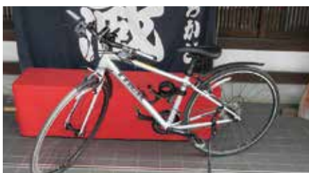
③クロスバイク(7台) 1,500円(1日)

土浦まちかど蔵「大徳」では、5種類のレンタサイクルを揃えております。街中の散策やつくば霞ヶ浦りんりんロードのサイクリングなどにぜひご利用ください。