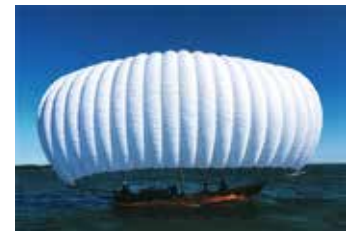
入選 (一社)霞ヶ浦市民協会賞 「ふっくら白帆」清水 千夏