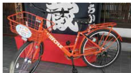
①シティサイクル(20台) 1,000円(1日)