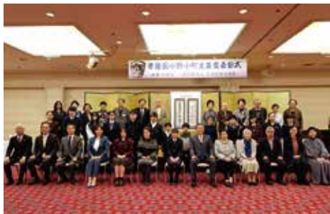
俳句部門受賞者の皆さま