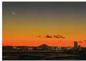
入選 株式会社LuckyFM茨城放送賞 「富士夕景」加納 政忠