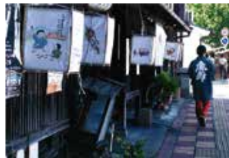
入選 土浦写真家協会賞 「美味ものあるかな」宮川 和男