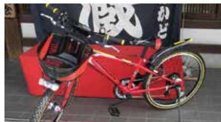
②ジュニアサイクル(3台) 1,000円(1日)

発行元：（一社）土浦市観光協会 〒300-0043 茨城県土浦市中央一丁目3番16号 TEL 029-824-2810 FAX 029-824-2819 URL https://www.tsuchiura-kankou.jp/