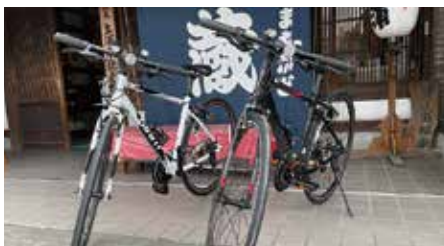
④クロスバイク(10台) 2,000円(1日)